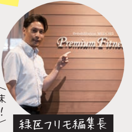
緑区フリモ編集長